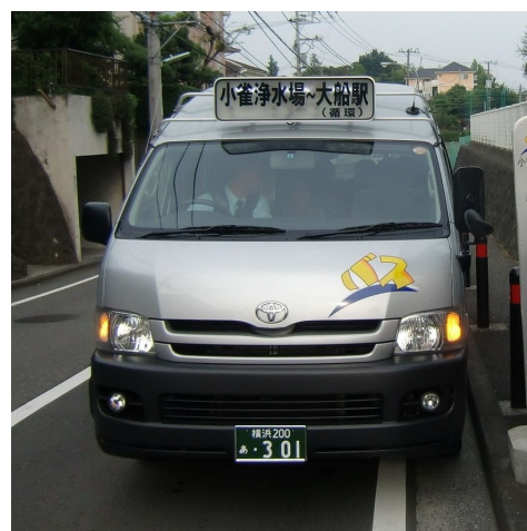
小雀乗り合いバス「こすずめ号」

栄区でも、豊田地区や上郷地区から本郷台駅方面へのアクセスに活用できるように、努力していきます。